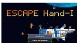
Jeu Escape Hand-I

Des expériences interactives qui gamifient vos formations.