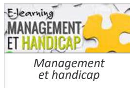
Management et handicap