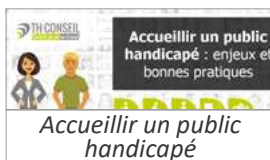
Accueillir un public handicapé