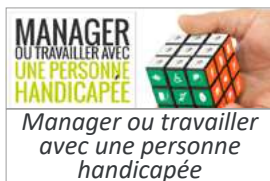
Manager ou travailler avec une personne handicapée

« Clé en main » ou sur mesure , intégrables sur votre LMS.