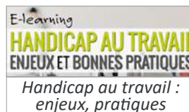
Handicap au travail : enjeux, pratiques